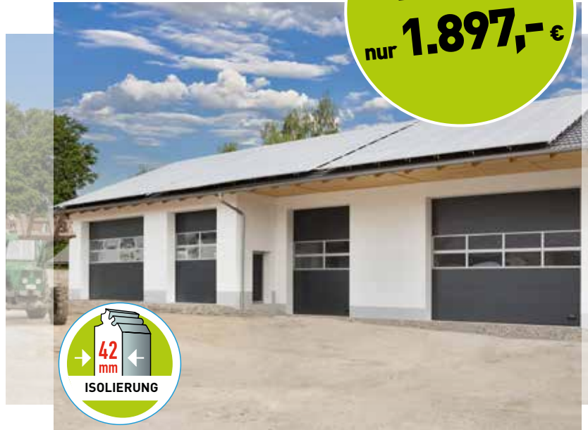
*Symbolfoto, Preis ohne Lichtband